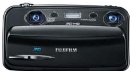
圖二 富士 FinePix Real 3D W3

回到一開始提到的 3D 影像，看過阿凡達之後不知道您會不會也想自己製作 3D 立體影像呢？這是最近消費型電子產品業的大熱門，各家大廠都在推出相關的產品，例如富士(Fujifilm)就是第一家推出消費型立體數位相機的廠商，FinePix Real 3D W1，主打人人都可以輕鬆拍攝立體相片，相機上的液晶螢幕更是可以讓使用者不需要帶任何眼鏡就可以看到清晰的立體影像，因此在市場上成為一大話題，而在 2010 年 9 月富士將要推出新的機型 FinePix Real 3D W3，以更輕薄的機型、更便宜的價格要來搶佔這塊市場。