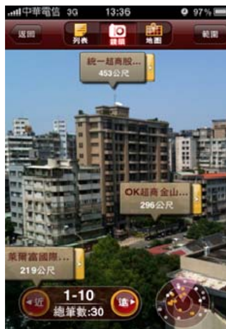
圖三 Android 和 iPhone 上的擴增實境軟體”hiPage 搜 go!”，圖片取自 hiPage 搜 go!官方網站

接著要介紹的是最近很紅的應用”擴增實境 Augmented Reality”，當您到一個陌生的地方，需要找便利商店、提款機或特定地址時，卻又不知道該怎麼走，這時候就可以使用擴增實境來幫助您找到想要的地方。透過使用 PDA 上的 GPS 定出使用者位置，再使用電子地圖找出目的地，最後將結果套疊在現場的影像上，讓使用者知道自己的目的地在何方，就不用拿著地圖慢慢研究，可以很直覺的就朝著自己目的地前進。類似的應用是導航系統，不過導航是以道路為主的規畫路徑，而不像擴增實境這樣直接告訴使用者目標的方向。但不管是哪種方法，這些技術都可以幫助我們到一個陌生的地方時不會迷路，能夠準確地到達我們想去的地方，出去玩時可說是相當方便的應用，可以不用花精神在找路上面，對背包客們可說是相當有用的。