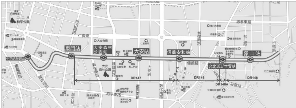
圖2 捷運信義線路線圖